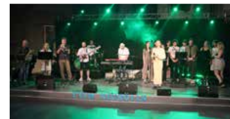
Fete de la musique 2024