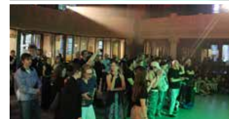
Fete de la musique 2024